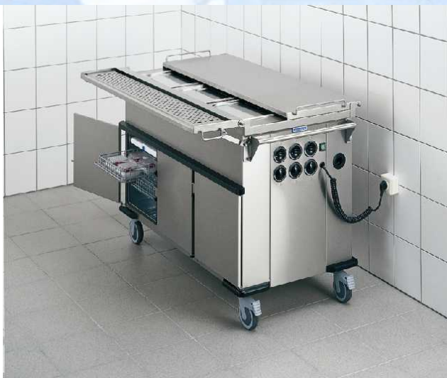
SPTW-2/EBF SPTW-3/EBF с откидной и сдвижной крышкой